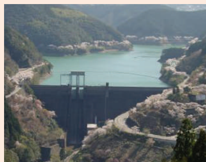
流域住民が経験した緊急放流の恐怖

ダムは、予想を超える大雨には対処できず、緊急放流によって下流を危険にさらします。市房ダムに加え、同時に川辺川ダムが緊急放流することは、現実的に十分にあり得ることなのです。そうなった場合、今回よりさらに壊滅的な被害が人吉市街地と球磨川流域を襲うことになるでしょう。