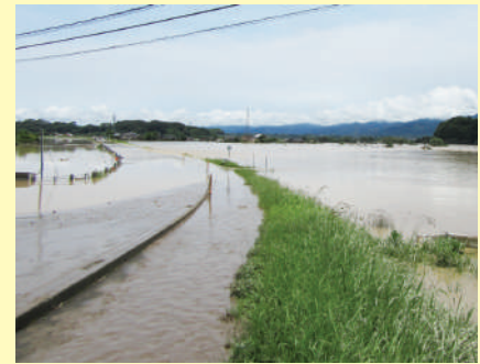
7月4日相良村陣の内はかつてない氾濫に

国や県は川辺川ダム建設を正当化するため、合流点で起きたこの出来事はなかったことにしようと必死です。