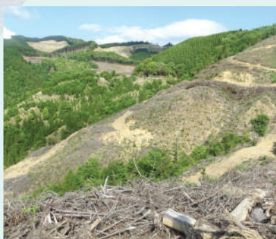
大規模皆伐や荒廃した山が急増

球磨川豪雨災害では、支流上流の数百家所以上で斜面崩落が発生し、流れ出た立木と土砂により、氾濫による被害が拡大しました。しかし、国や県は森林の問題を検証することなく、ダムと堤防強化を柱にした、名ばかりの「緑の流域治水」を進めています。